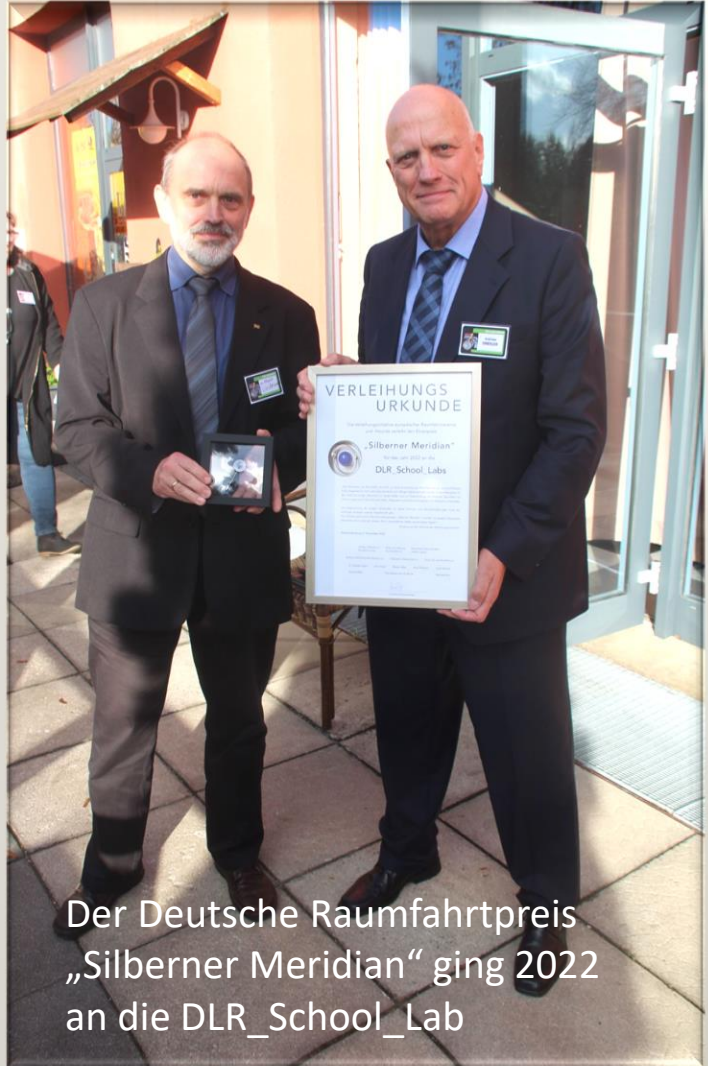
Der Deutsche Raumfahrtpreis „Silberner Meridian“ ging 2022 an die DLR_School_Lab