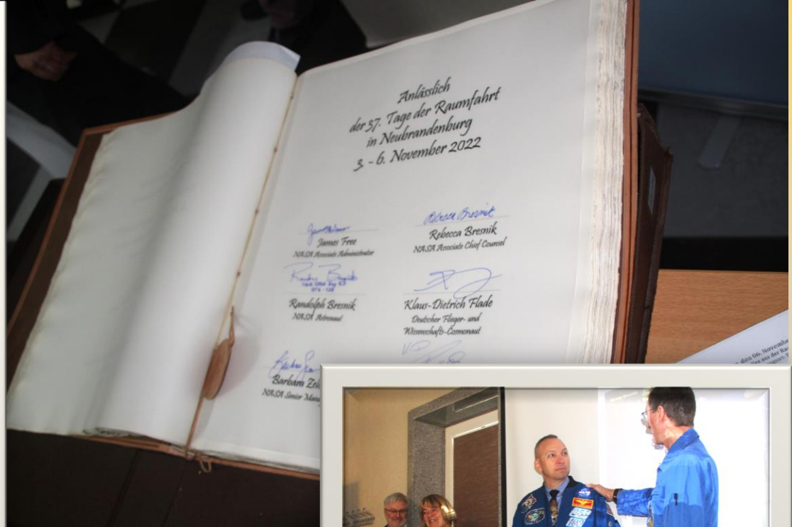
Eintrag in das „Goldene Buch“ der Stadt. Randy Bresnik wurde als 50. Raumfahrer, der Neubrandenburg besuchte, geehrt.