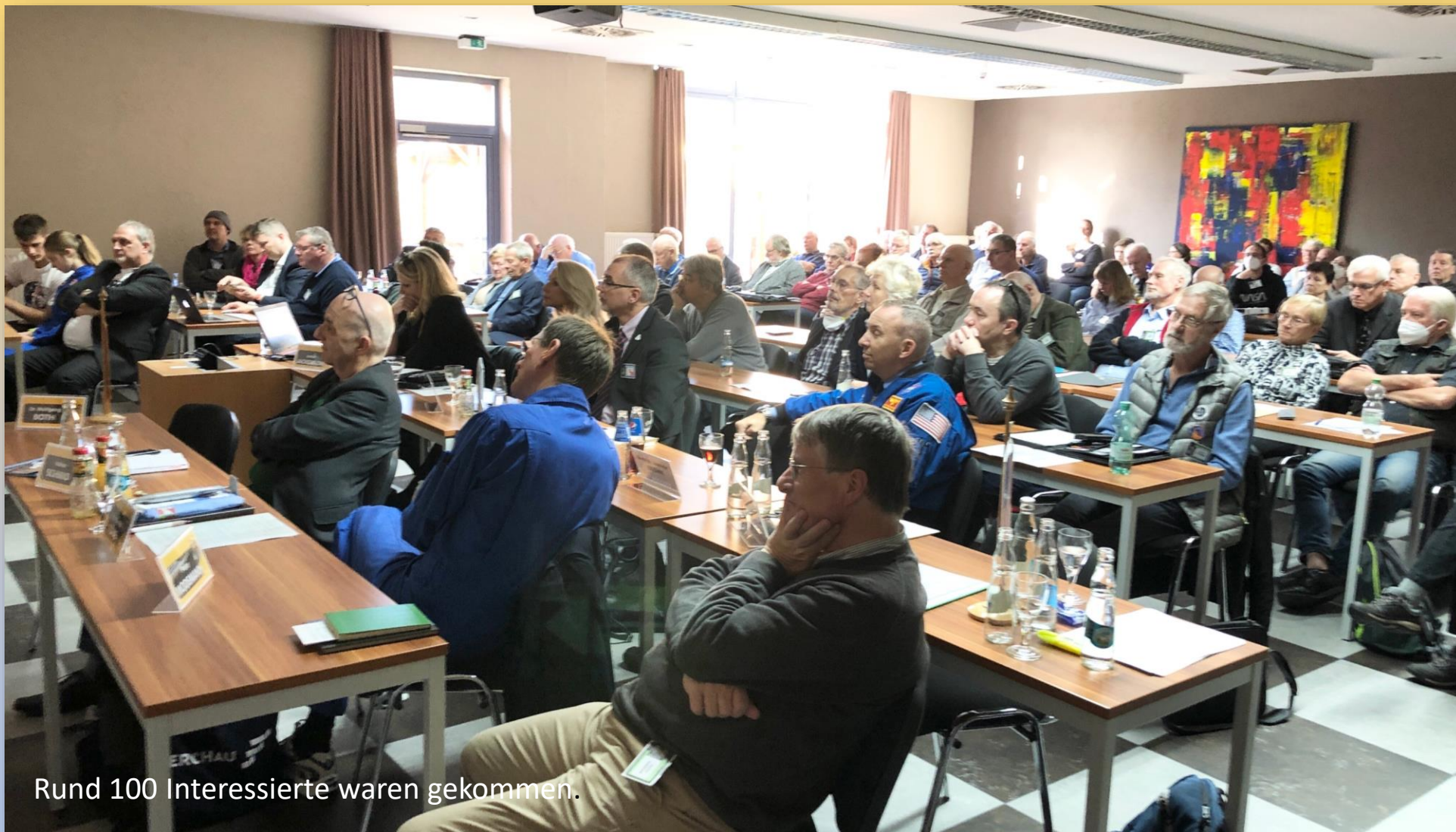
Rund 100 Interessierte waren gekommen.